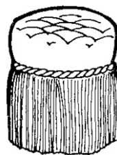
Capitonnage et frange